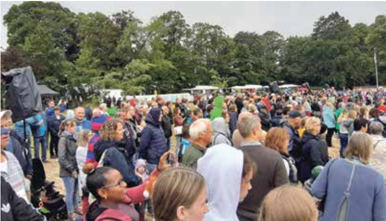
Zahlreiche Besucher strömten zur Neptunaufrufe