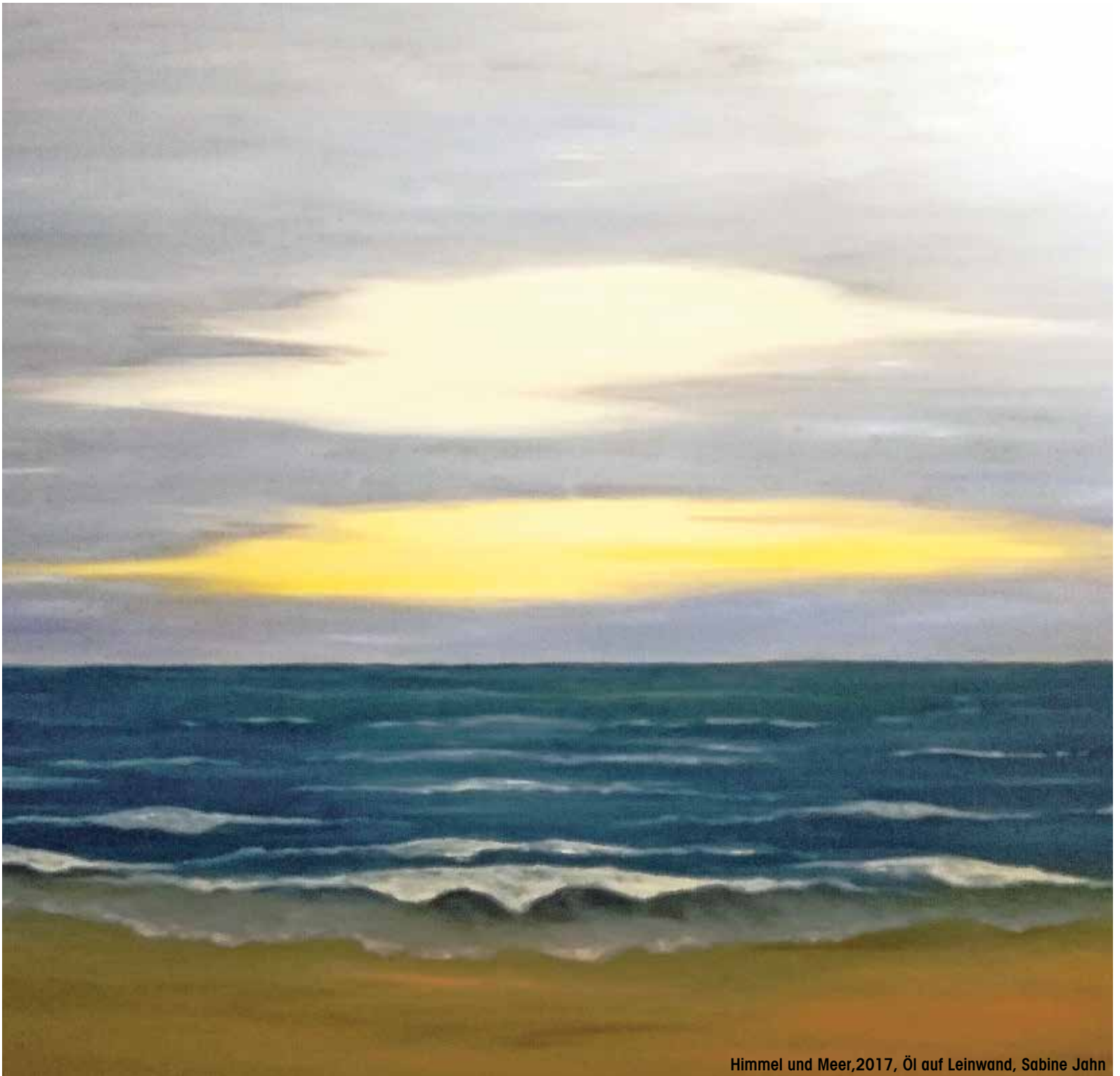
Himmel und Meer, 2017, Öl auf Leinwand, Sabine Jahn

Amtliche Bekanntmachungen und Informationen des Amtes Zarrentin, der Stadt Zarrentin am Schaalsee, der Gemeinden Gallin, Kogel, Lüttow-Valluhn, Vellahn, des Schulverbandes Zarrentin und des Planungsverbandes „Transportgewerbegebiet Valluhn/Gallin“